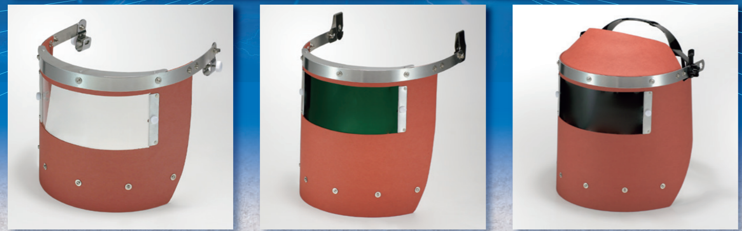
FB775T-6 アクリル透明 外寸 (H) 200×(W) 360 窓寸 (H) 80×(W) 200 FB776T-11 G3 外寸 (H) 245×(W) 360 窓寸 (H) 80×(W) 200 FB777(RF)-N4A IR11 外寸 (H) 245×(W) 480 窓寸 (H) 80×(W) 200 電動ファンマスク併用推奨品