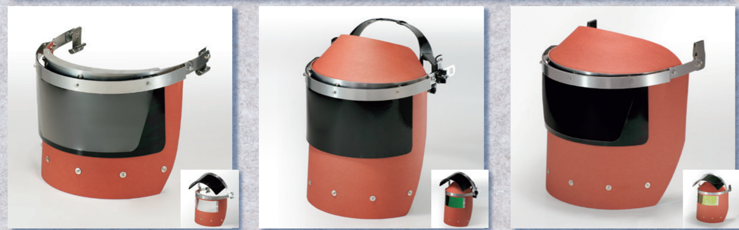
FB775WT-7 外IR8/内アクリル透明 外寸 (H) 200×(W) 360 窓寸 (H) 80×(W) 200 外レンズ (H) 125×(W) 280 FB776W(RF/KF)-N4A 外G7/内G2 外寸 (H) 245×(W) 360 窓寸 (H) 80×(W) 200 外レンズ (H) 125×(W) 280 FB777W(RF)-11 外IR11/内IR1.7 外寸 (H) 245×(W) 480 窓寸 (H) 80×(W) 200 外レンズ (H) 125×(W) 280 電動ファンマスク併用推奨品

価格はパーツ、レンズの組み合わせにより変わりますので代理店までお問い合わせください 特注サイズ希望や改良要望などがありましたらお気軽にご相談ください